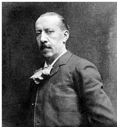
Portret Charles Marie Widor