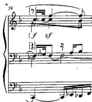
Simfonia Romana, Choral , măs. 57-59, motivul Tristan „erou”

Așa cum am mai menționat la început prima parte a simfoniei este bazată pe tema cântecului gregorian Haec dies , Charles-Marie Widor folosind doar primele două fraze; Haec dies și Quam fecit .