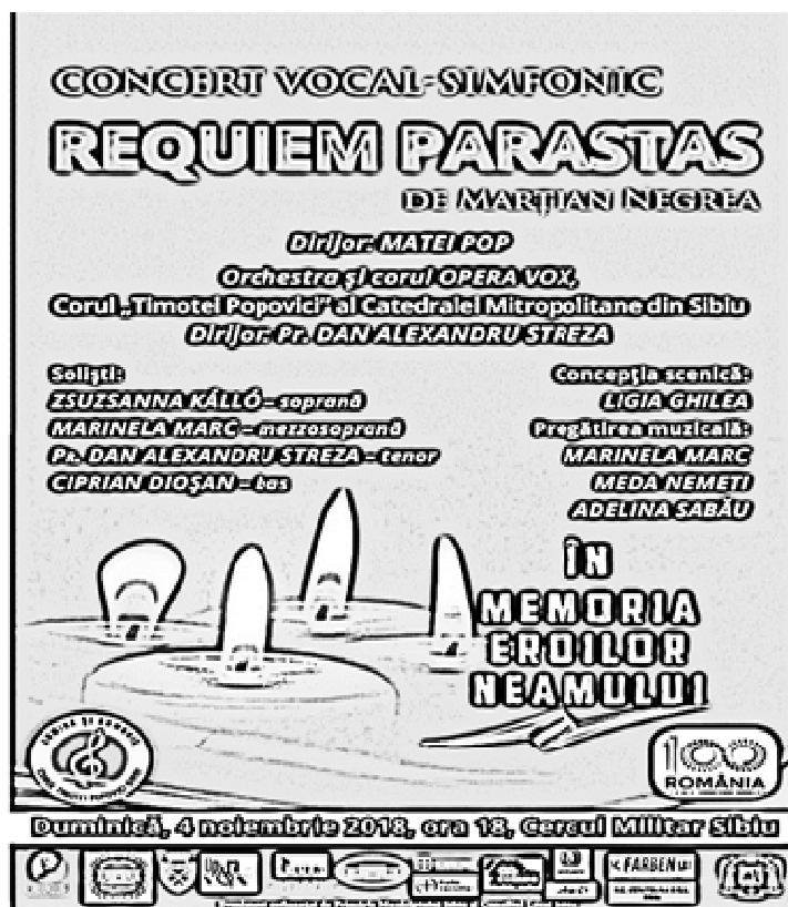
Imaginea 6: Afișul prezentării publice a Requiemului – Parastas al lui Marțian Negrea la Sibiu, 2018