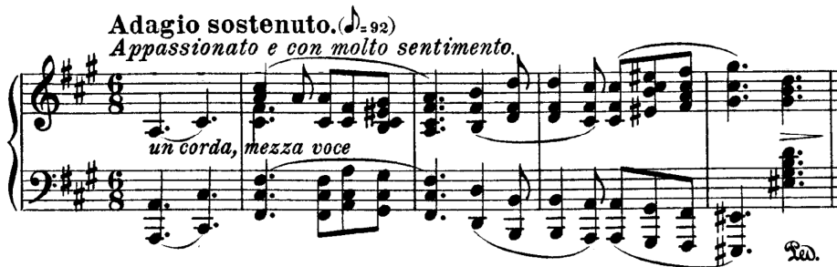
Exemplul 3: L. Van Beethoven: Sonata nr. 29, Op. 106 – Partea a III-a Example 3: L. Van Beethoven: Sonata no. 29, Op. 106 – Third Movement

Third movement, Adagio sostenuto, Appassionato e con molto sentimento, f-sharp minor, was recognized as one of the most remarkable slow movements in Beethoven's creation. In addition to the harmony that is achieved in the succession of the parties, another combination of the whole is the third intervalic relationship, which stands out both in the harmonic level and in the themes plan. These, as well as the richness of the texture, reflect the tendencies of Beethoven's late pianoism.