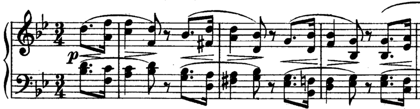
Exemplul 2: L. Van Beethoven: Sonata nr. 29, Op. 106 – Partea a II-a Example 2: L. Van Beethoven: Sonata no. 29, Op. 106 – Second Movement

A treia parte, Adagio sostenuto, Appassionato e con molto sentimento, fa-diez minor, a fost recunoscută ca una dintre cele mai remarcabile mișcări lente din creația lui Beethoven. Pe lângă armonia care se realizează în succesiunea părților, o altă combinație a întregului o constituie relația intervalică de terță, care se evidențiază atât în plan armonic cât și în plan tematic. Acestea, cât și bogăția texturii reflectă tendințele pianismului târziu al lui Beethoven.